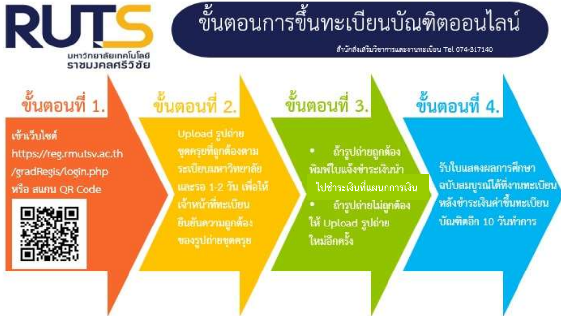
รูปแสดงขั้นตอนการขึ้นทะเบียนบัณฑิตออนไลน์

ขั้นตอนที่ 1. เข้าสู่ระบบ http://reg.rmutsv.ac.th/gradRegis/login.php